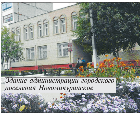
Здание администрации городского поселения Новомичуринское